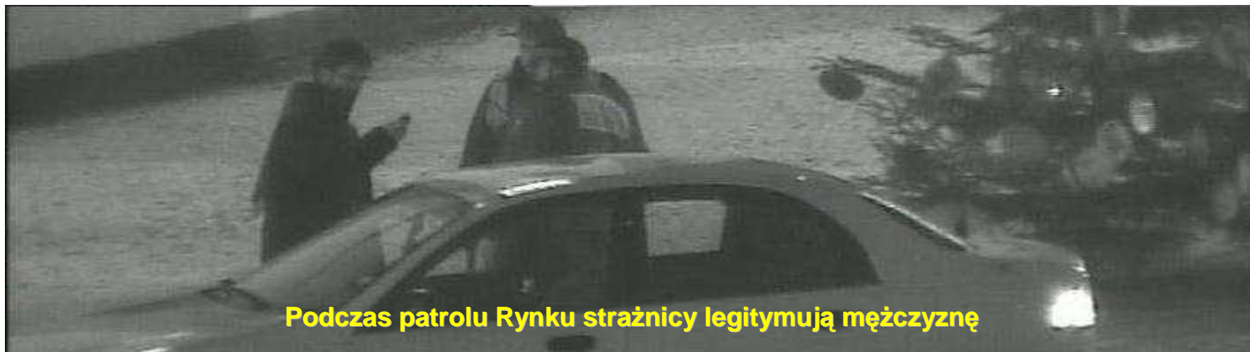
Podczas patrolu Rynku strażnicy legitymują mężczyznę