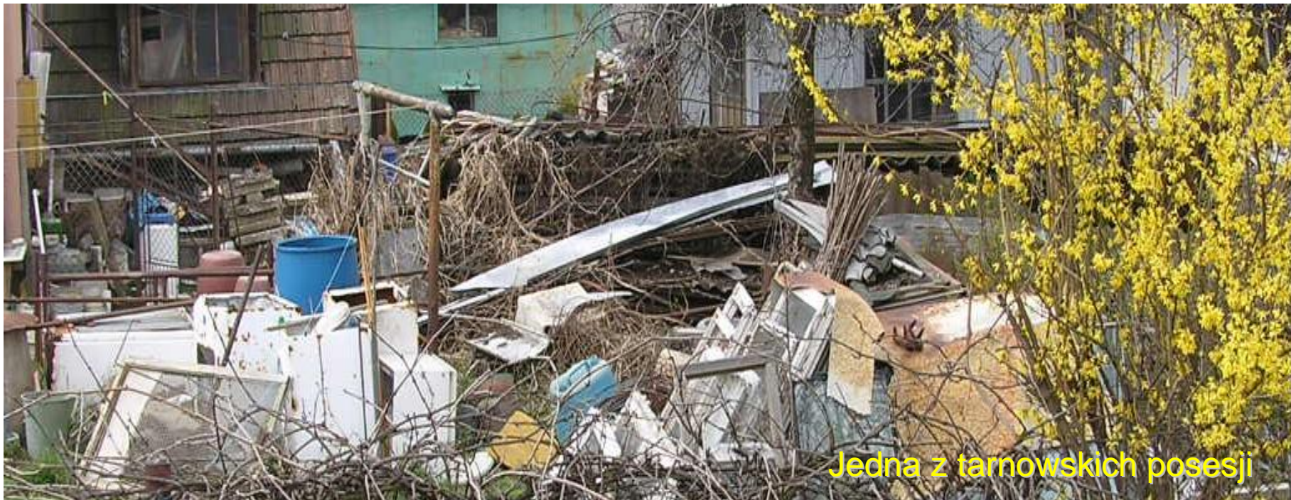
Jedna z tarnowskich posesji