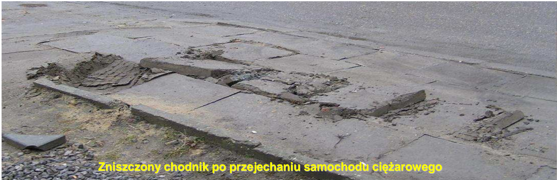
Zniszczony chodnik po przejechaniu samochodu ciężarowego