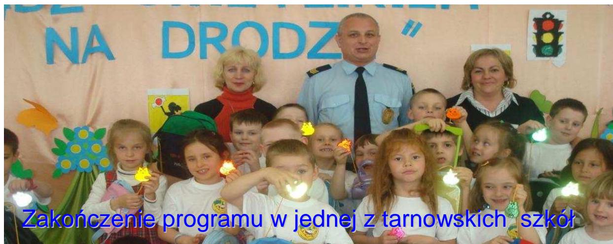
Zakończenie programu w jednej z tarnowskich szkół

Programem objęto 7 szkół podstawowych w 75 oddziałach, w których uczestniczyło 1685 dzieci, 2 przedszkola w których uczestniczyło 10 grup posiadających 208 dzieci,