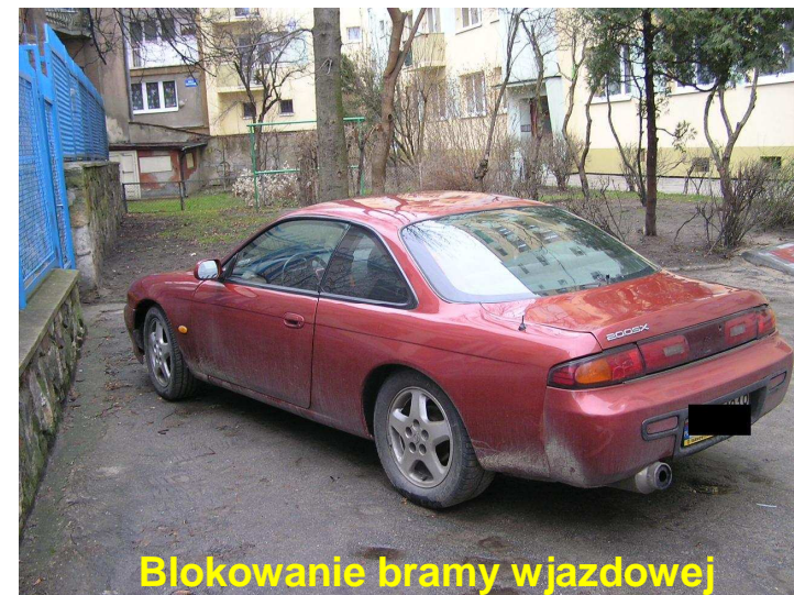
Blokowanie bramy wjazdowej