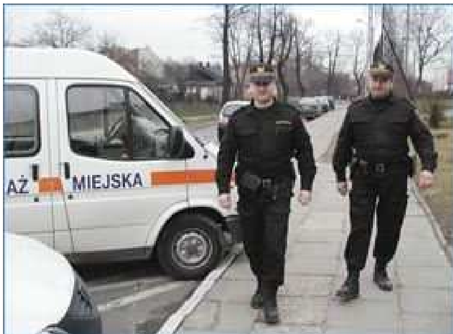
Patrol Straży Miejskiej