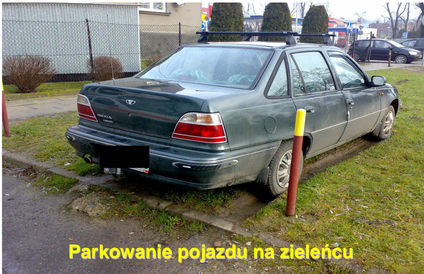
Parkowanie pojazdu na zieleńcu

Interwencji związanych z ujawnionymi wykroczeniami z tego zakresu strażnicy podjęli 1033, z czego: