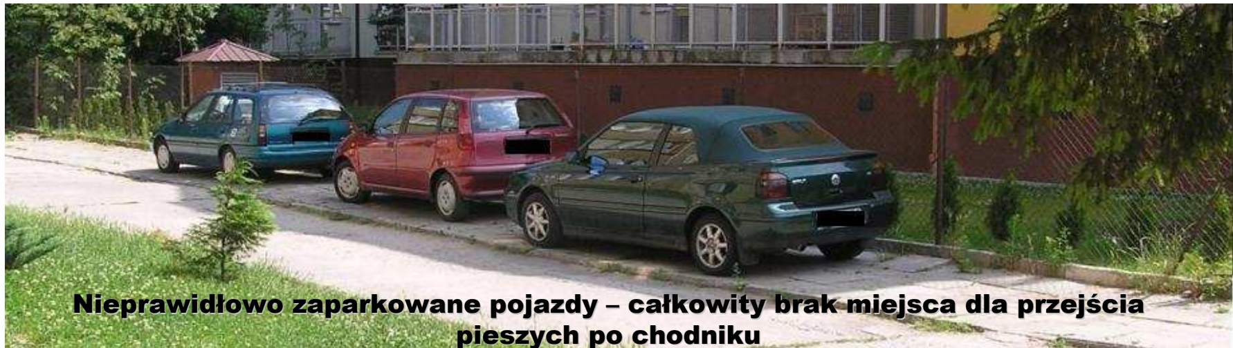
Nieprawidłowo zaparkowane pojazdy – całkowity brak miejsca dla przejścia pieszych po chodniku

Za inne wykroczenia porządkowe wynikające z aktów prawa miejscowego pouczyli 1161 osoby i nałożyli 50 zawiadomień (głównie za brak opłat parkingowych)