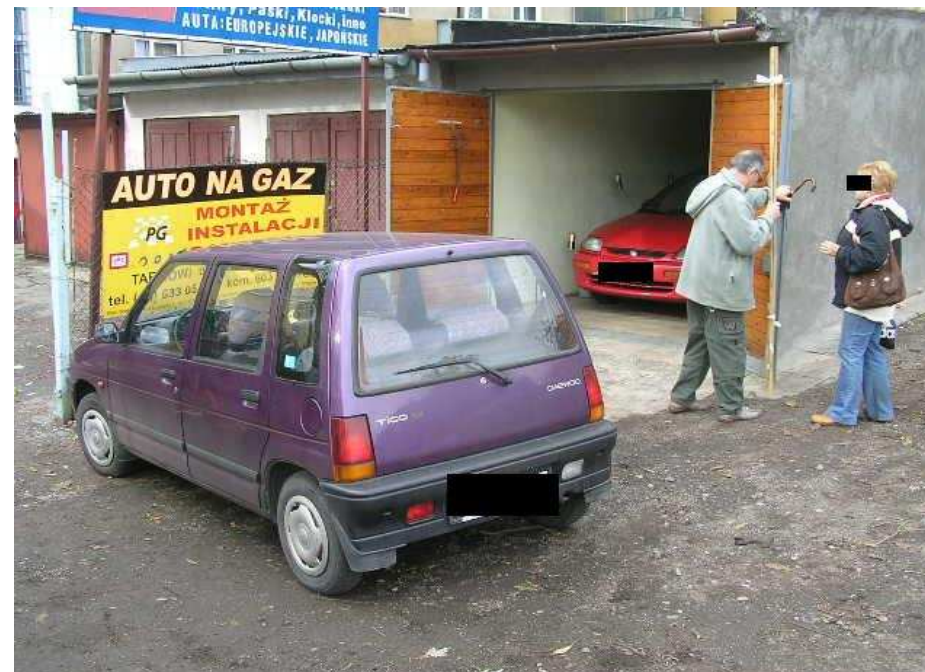
Zablokowany garaż przez źle zaparkowany pojazd